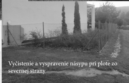
Vyčistenie a vyspravenie násypu pri plote zo severnej strany