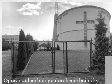
Oprava zadnej brány a dorobenie bráničky

Za obdobie 2015/2016 sme o.i. zrealizovali: