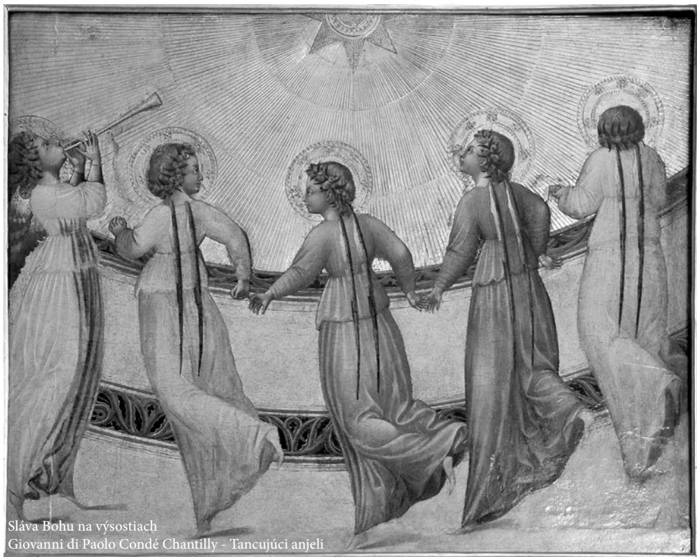
Sláva Bohu na výsostiach Giovanni di Paolo Condé Chantilly - Tancujúci anjeli

„KIEĹ BY SI PRELOMIL NEBESÁ A ZOSTÚPIL, VRCHY BY SA TRIASLI PRED TVOJOU TVÁROU.“ (Iz 63,19)