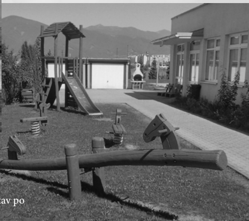
... stav po