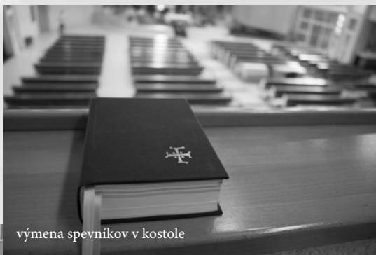
výmena spevníkov v kostole