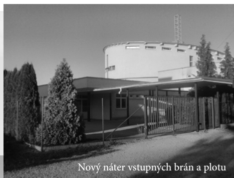
Nový náter vstupných brán a plotu